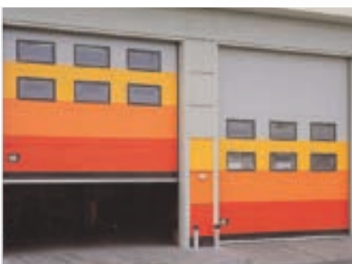
Porte coulissante et articulée